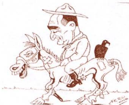
ARQUIVO EURICO DUTRA. Um urubu pousou na minha sorte. Disponível em: < www.cpdoc.fgv.br >.

Esta charge faz referência a um momento importante da história política brasileira, ou seja,