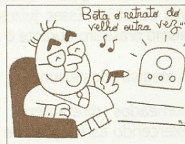
FAUSTO, Bóris. Getúlio Vargas: o poder e o sorriso . São Paulo: Companhia das Letras, 2006.

Esta charge, inspirada em uma marcha de carnaval interpretada por Francisco Alves, faz referência